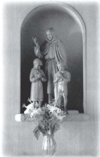
聖アンジェラ・メリチ 聖ウルスラ修道会創立者